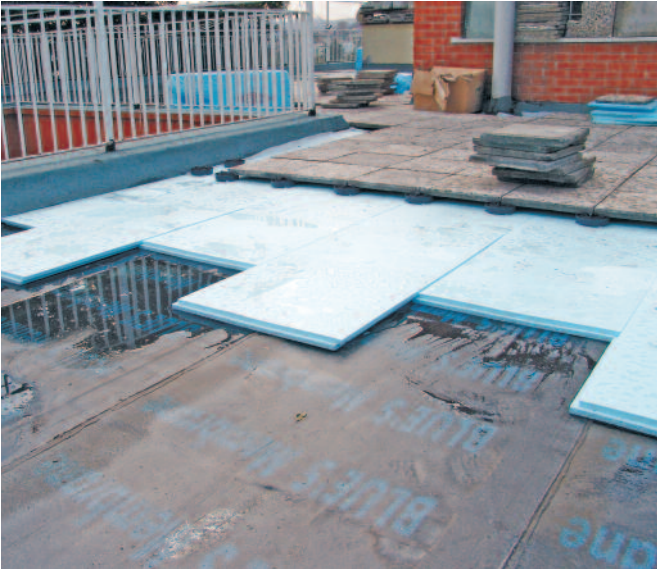
4-Isı yalıtımı, Jeotekstil, Karo ayakları ve karoların yerleştirilmesi