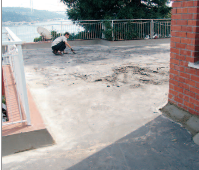
1-Meyil ve pahlarla alt yapının hazırlanması

2 kat SBS katkılı 3mm. kalınlıktaki Blue's Membran su yalıtımı üzerinde 50 mm. kalınlıkta Roofmate SL XPS ısı yalıtımı