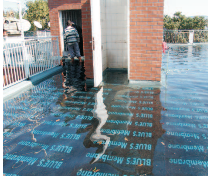
3-Su testi yapılması