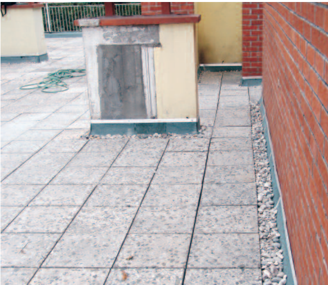
6-Baskı çıtaları ve kenar çakılları ile bitiş detaylarının yapılması