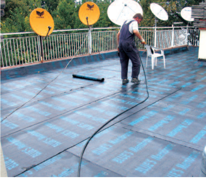
2- İki kat Blue's Membran su yalıtımı yapılması